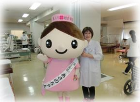
＜健康チェック・健康相談コーナー＞